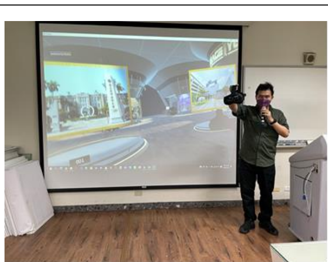
數位學習精進領航師資研習-講師授課(1)