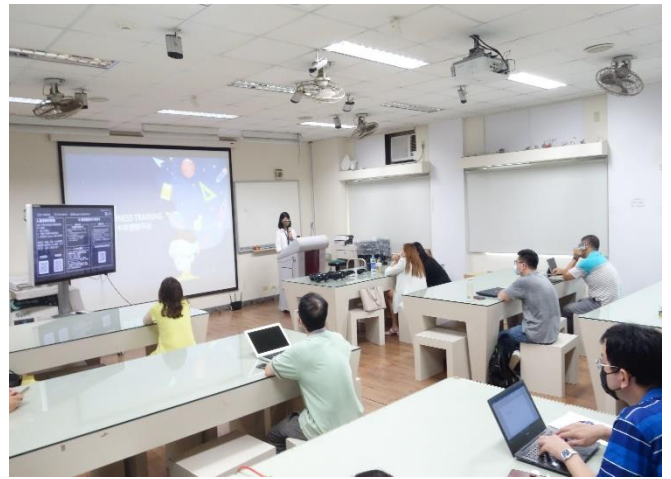
5G/VR 科技應用進階研習-上課實況