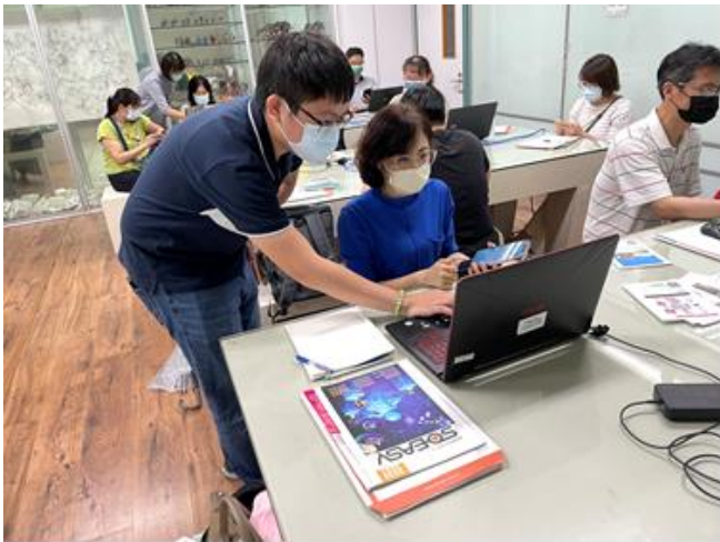
數位學習精進領航師資研習-課程老師協助學員操作